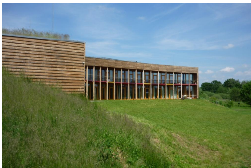
Centrum ekologických aktivit „Sluňákov“