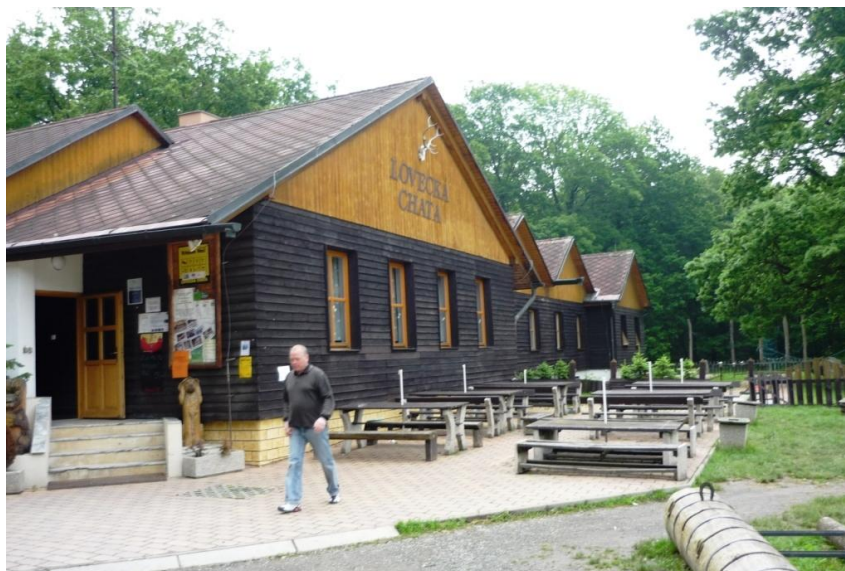
Lovecká chata byla v neděli po ránu ještě klidná. Jinak tam byl velký cvrkot.