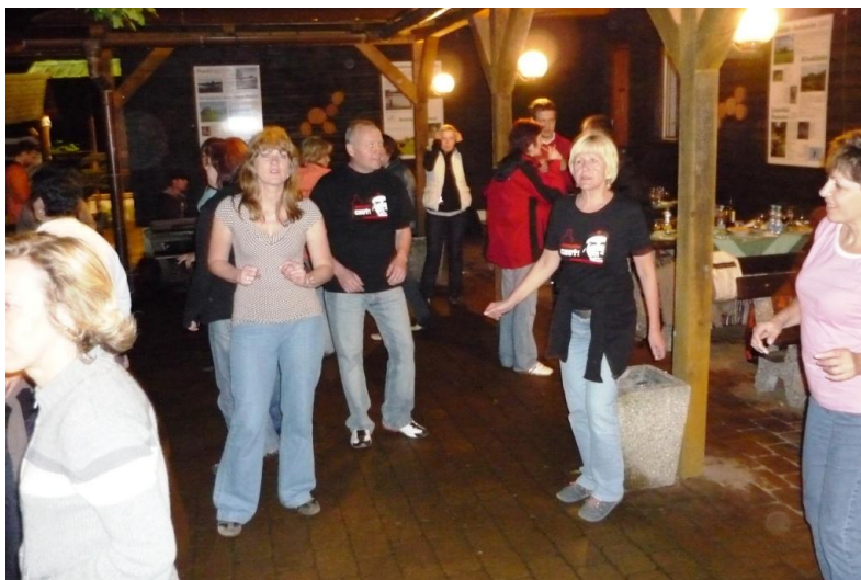
Nějací zdravotníci měli v atriu Lovecké chaty večírek s hudbou, tak jsme se k nim přidali. Hrál revival „Pražský výběr“