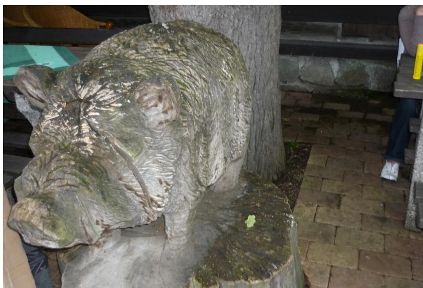
Jeden z mnoha dřevěných společníků u Lovecké chaty v Horce n.M.