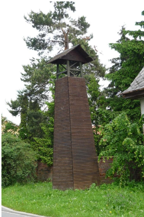
Zvláštní zvonička v Haňovicích