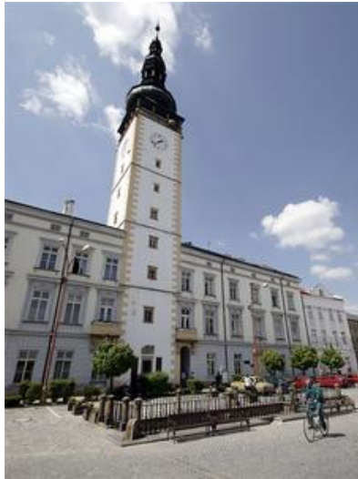
Radnice v Litvli