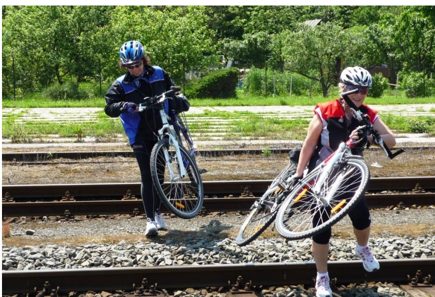
Stezka končila u nádraží v Příkazech a vesnice byla na druhé straně kolejí.