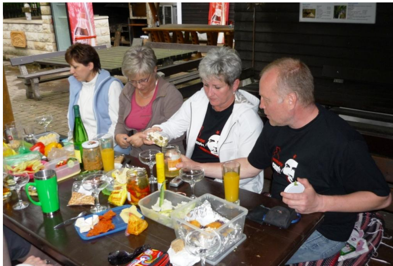
V sobotu už jsme si „vařili“ sami.