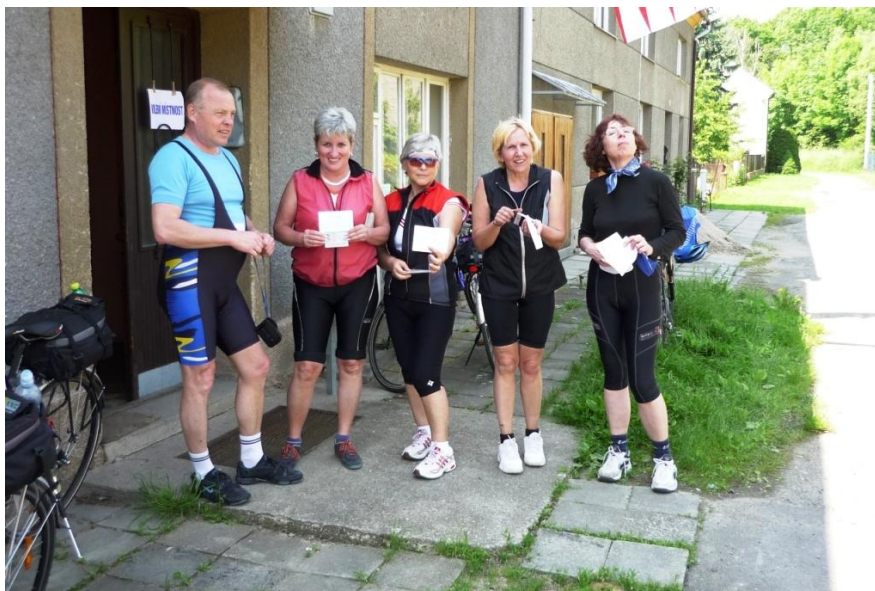
Před volební místnosti v Příkazech-Hynkově, kde jsme provedli volbu. Papíry v rukou jsou voličské průkazy, které jsme si vyřídili předem.