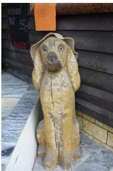
Zdatný hlídač u vchodu do Lovecké chaty