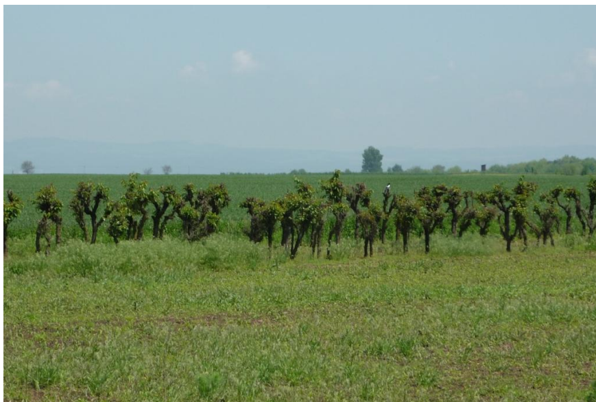
Záhadné stromořadí cestou do Příkaz