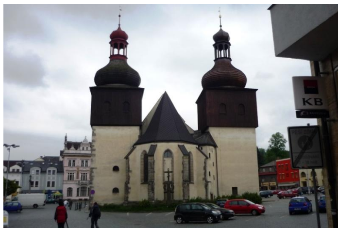
Kostel Sv. Vavřince postavený v letech 1709 -1716

Pěší skupina dorazila do Náchoda v době vhodné na oběd. Jejich hlasitý rozhovor vyslechl jeden z místních občanů a hned upozornil, že není vhodné jít na oběd do hotelu Beránek a už vůbec ne do restaurace Panorama. Pokud se chceme dobře najíst, máme navštívit restauraci „U Slovana“. Pěší skupina se tam vydala a musíme konstatovat, že domorodec měl pravdu. Rychlá obsluha, výborné jídlo, příjemné prostředí. Pro ty, kteří pojedou do Náchoda a chtějí se dobře najíst, tato restaurace se nachází v rohu Masarykova náměstí, hned vedle staré radnice. Na horním snímku to je ten růžový domeček krčící se vedle ní.