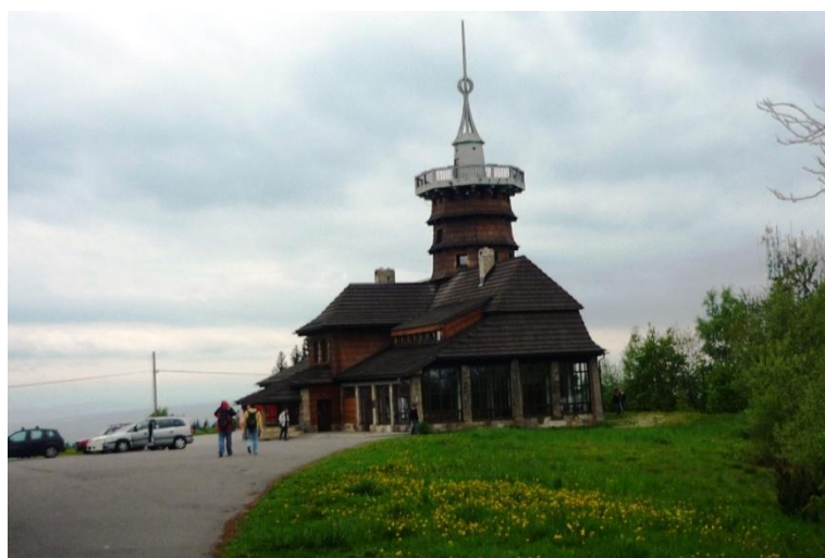
Jiráskova chata u Dobrošova

Část pacifistů raději zvolila procházku z Dobrošova po „Jiráskově cestě“, kolem Jiráskovy chaty s rozhlednou, do Náchoda a prohlídku města.