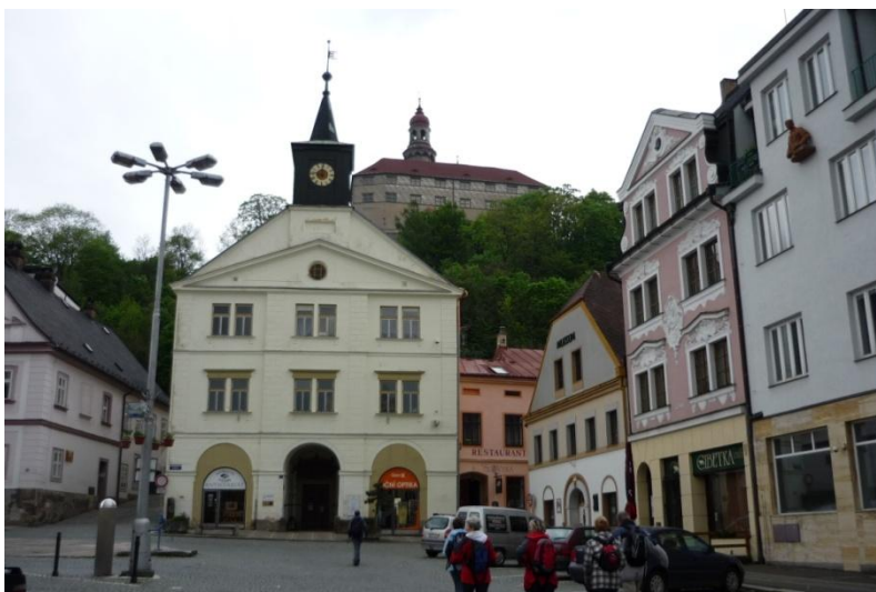
Stará radnice s Náchodským zámekem v pozadí, při pohledu z Masarykova náměstí

Pěší skupina dorazila do Náchoda v době vhodné na oběd. Jejich hlasitý rozhovor vyslechl jeden z místních občanů a hned upozornil, že není vhodné jít na oběd do hotelu Beránek a už vůbec ne do restaurace Panorama. Pokud se chceme dobře najíst, máme navštívit restauraci „U Slovana“. Pěší skupina se tam vydala a musíme konstatovat, že domorodec měl pravdu. Rychlá obsluha, výborné jídlo, příjemné prostředí. Pro ty, kteří pojedou do Náchoda a chtějí se dobře najíst, tato restaurace se nachází v rohu Masarykova náměstí, hned vedle staré radnice. Na horním snímku to je ten růžový domeček krčící se vedle ní.