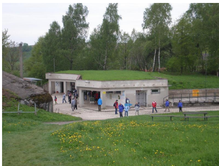
Části pevnosti Dobrošov

Část pacifistů raději zvolila procházku z Dobrošova po „Jiráskově cestě“, kolem Jiráskovy chaty s rozhlednou, do Náchoda a prohlídku města.