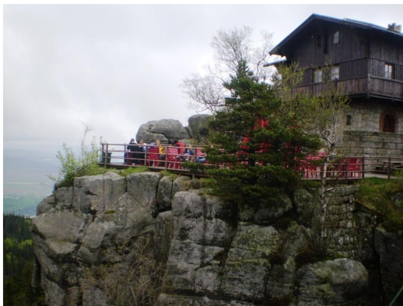
Schrtonisko na Szcelincu