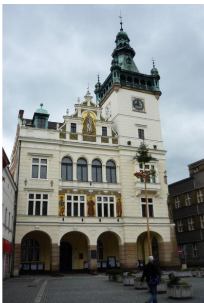
Náchodská radnice (1902-1904)