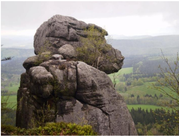
Goryla v Gorach Stolowych