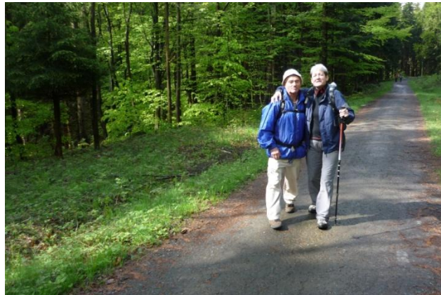
Důkaz, že nám v sobotu svítlo i sluníčko.