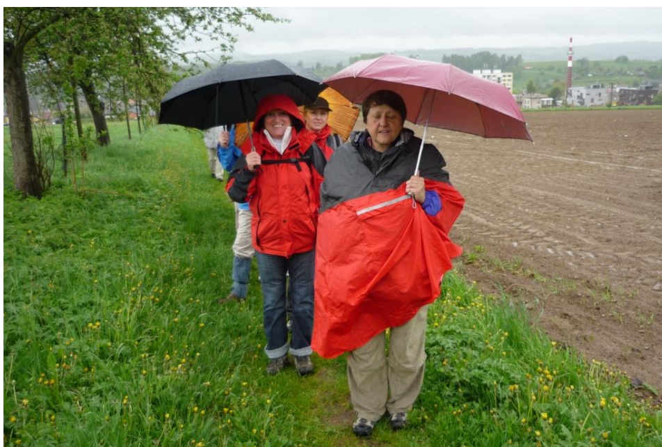
Vycházíme z Police nad Metují. Humor nás neopouštěl ani v tomto počasí.

V 07.30 hodin odjíždíme od Domu kultury Ostrava směr Police nad Metují. Lije jak z konve, zamračeno. Prší po celou cestu až do cílového města. Vzhledem ke kolonám v Náchodě dojíždíme do Police nad Metují s hodinovým zpožděním oproti plánu. Musíme se rozhodnout, zda vymyslíme nějaký náhradní program nebo vyrazíme na připravenou trasu v Broumovských skalách. Většina účastníků zájezdu se nakonec rozhodne vyrazit do skal i za tohoto nepříznivého počasí.